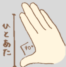
親指から人差し指の長さは一咫（ひとあた）というんだよ！

10センチってどれくらい？手でなんとなく予想してみよう。さあ定規をあてて正解を見てみよう。合っていたかな？ 定規やメジャーがないと意外と物の正確な長さは分からないもの。そんなときは自分の体のパーツの長さを知っておくととても便利！親指から人差し指の長さ、両腕を広げたときの長さなどが分かれば、キャンプや作業をするときに木を30cmくらいに切ったり、10メートルのロープをばばつと用意したりとワンランク上のアウトドアができるようになるぞ！